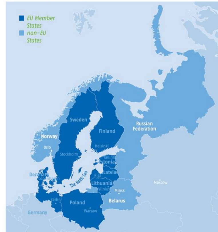
Baltic Sea Region Programme area 2007 - 2013