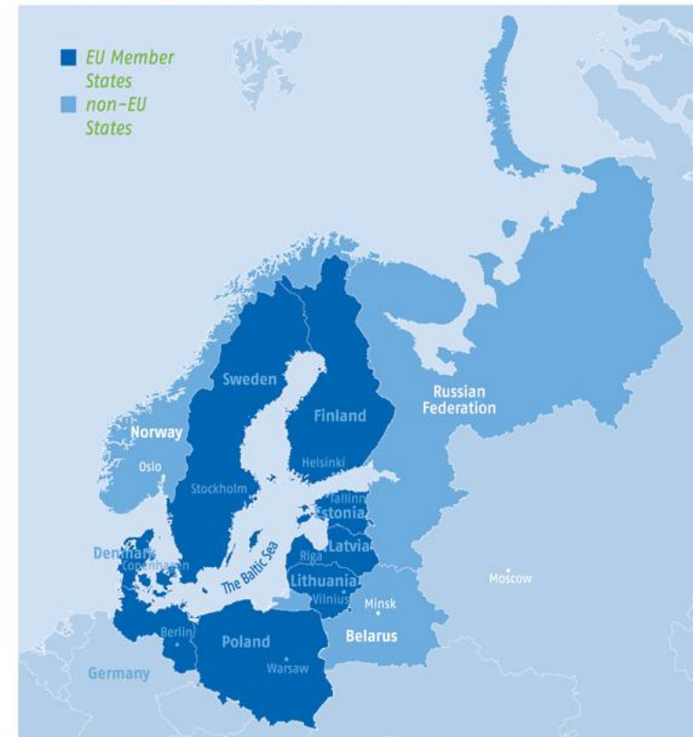
Baltic Sea Region Programme area 2007 - 2013