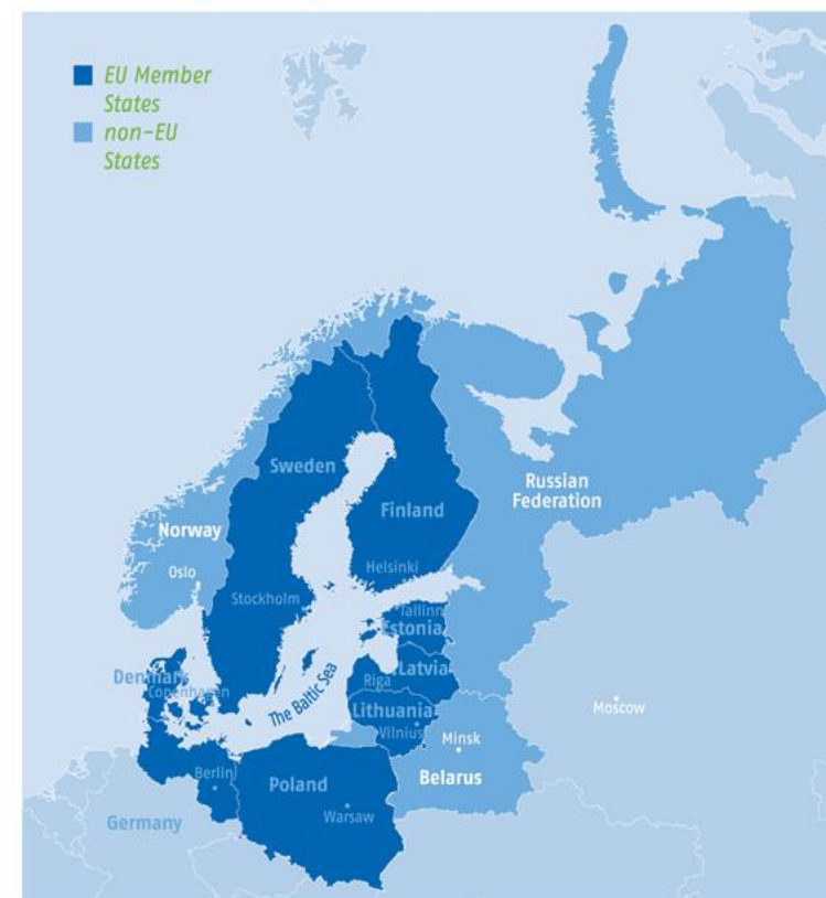
Baltic Sea Region Programme area 2007 - 2013