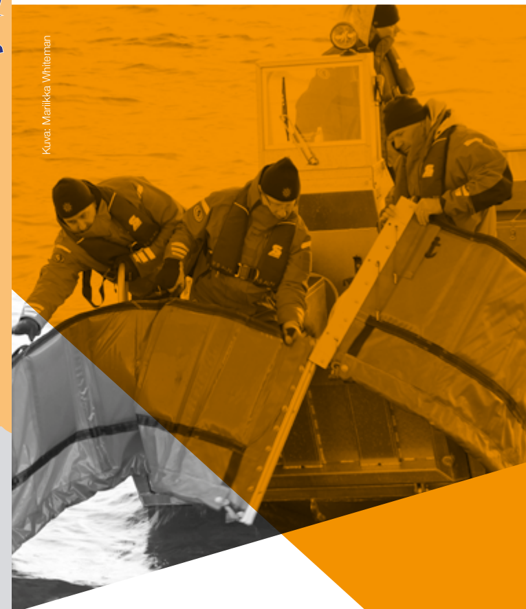
Kuva: Marikka Whiteman

ÖLJYNTORJUNTA- VALMIUDEN EDISTÄMINEN ITÄMEREN ALUEELLA 2019–2021