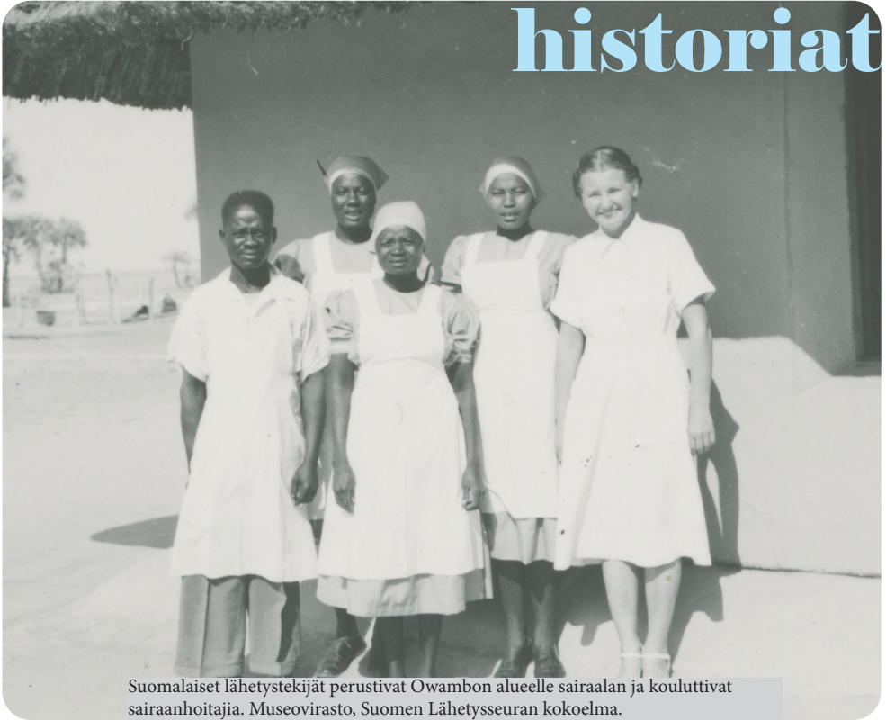
Suomalaiset lähetystekijät perustivat Owambon alueelle sairaalan ja kouluttivat sairaanhoitajia.

O ppiaineessa toimii Koneen Säätiön rahoittama tutkimushanke, jossa tarkastellaan Suomi-Namibia-suhteen historiaa. Maantieteellisesti toisistaan kaukaiset ja kulttuurisesti erilliset Suomi ja Namibia muodostavat historiallisesti mielenkiintoisen kombinaation. Suomen Lähetysseura aloitti lähetystyön vuonna 1870 Owambon alueella (tunnettiin tuolloin Ambomana) nykyisessä Pohjois-Namibiassa. Työ on jättänyt vahvat jälkensä alueen kulttuuriseen ja yhteiskunnalliseen kehitykseen. Suomalaisilla oli myös kes-