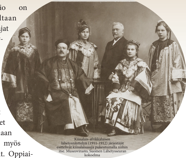
Kiinalais-afrikkalaisen lähetysnäyttelyn (1911-1912) järjestäjät esittelivät kiinalaisasuja pukeutumalla niihin itse.

1600-luvun kuriositeettikabinetteja, 1800-luvun näyttelymedian käytäntöjä, maailmannäyttelyissä ilmenevää edistysuskoa sekä kaukomaiden eksoottisten esineiden päätymistä suomalaiskokoelmiin ja -näyttelyihin.