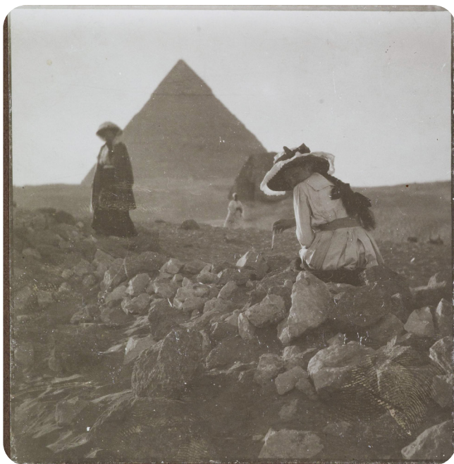
Akseli Gallen-Kallelan perhe matkaili siirtomaa-ajan Afrikassa. Valokuvassa taiteilijan vaimo ja tytär.

Suomessa. Kesällä 2024 ilmestyi Suomi-Namibia-suhteen koloniaalisia piirteitä käsittelevä kokoomateos. Kolonialismiaiheet ovat säännöllisesti mukana perustutkinto-opetuksessa, ja järjestämme myös tutkijoille suunnattua kolonialismin historian seminaaria.